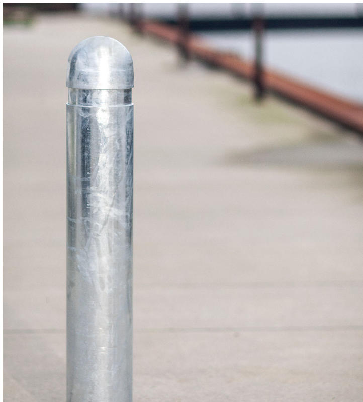
Lenta BIG N